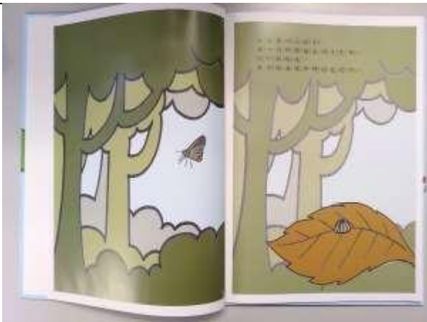
直式內頁 第1 頁(從左側開始)