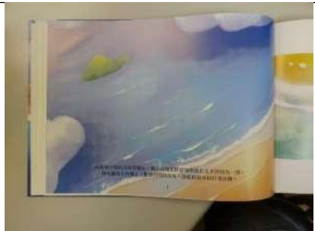
橫式內頁 第1 頁(從左側開始)